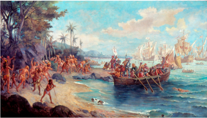
Obra de Oscar Pereira da Silva que retrata a chegada dos primeiros portugueses ao Brasil